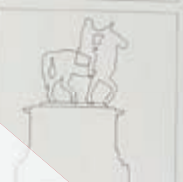
1949. PLAZA SAN JUAN. NEW ORLEANS. MEXICO