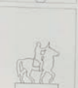
1949. PATIO CAPITANIA GENERAL. VALENCIA