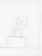
1947. ESCUELA DE INGENIEROS. PALAZO